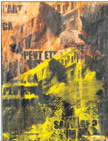
«L'art, ça peut être sauvage?» L'oeuvre de Philippe Reymondin évoque l'affichage sauvage. (P. REYMONDIN)